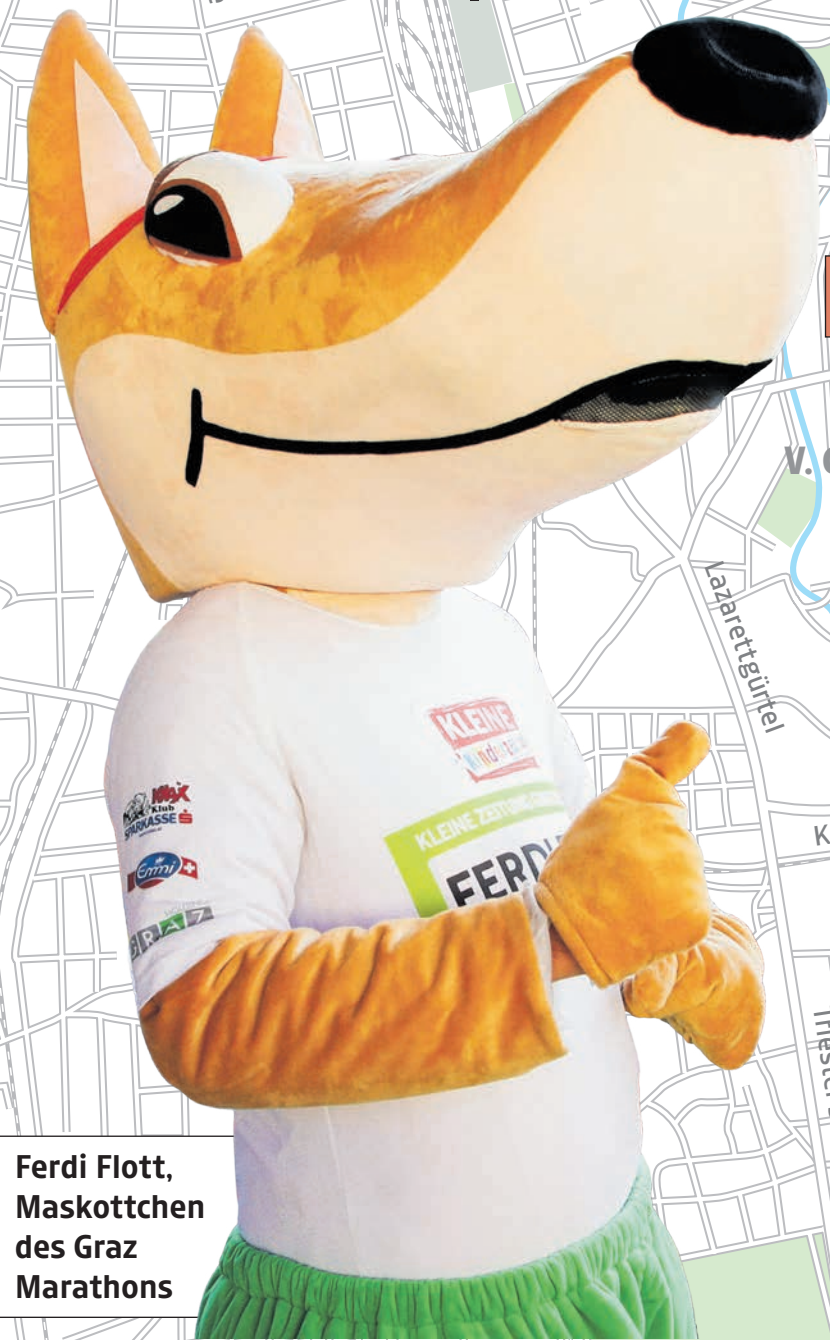
Ferdi Flott, Maskottchen des Graz Marathons