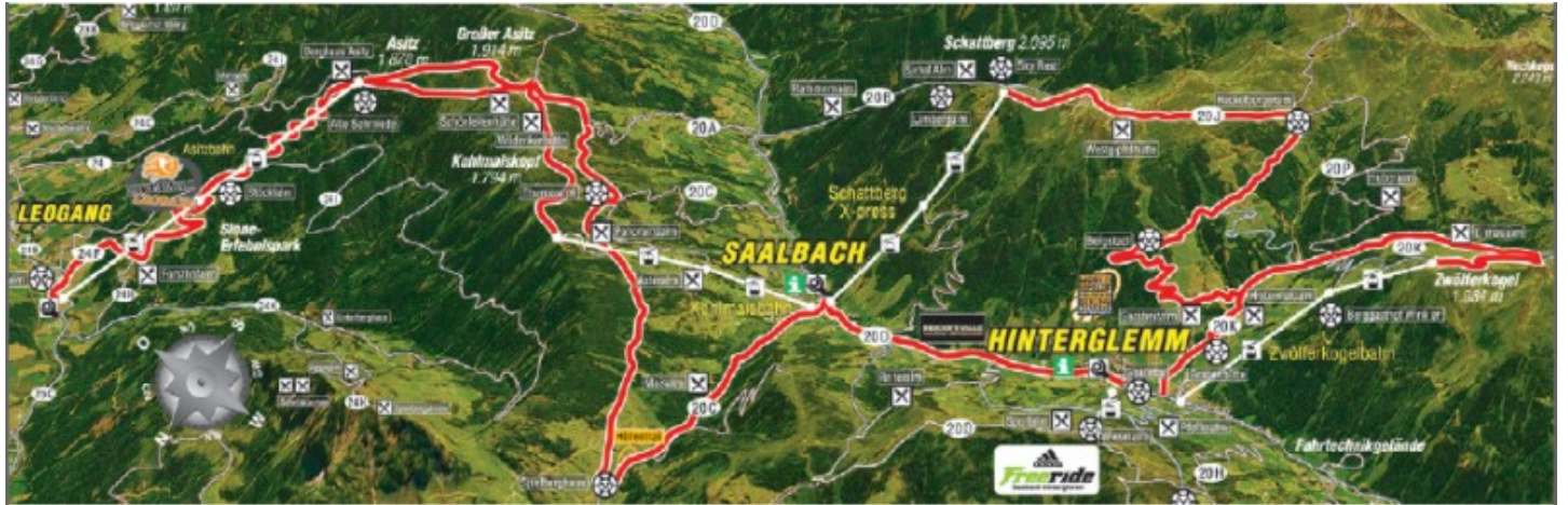
Karte/Topo: Übersichtskarte Fünf Gondel Tour